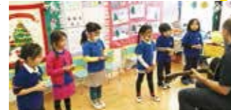
日本にいながらバイリンガルに!

ブルードルフィンズでは、2020年度の英語幼稚園生を募集します。幼稚園の3年間、外国人講師から学ぶ英語環境にて、自然と英語コミュニケーション能力を身に付けます。