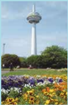
園内には花壇や植え込みも整備され、四季折々の植物が楽しめる。