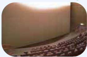
大型映像館では子どもたちが楽しめる作品を上映