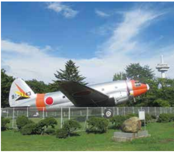
日本初の飛行場の跡地に開園した通称「航空公園」