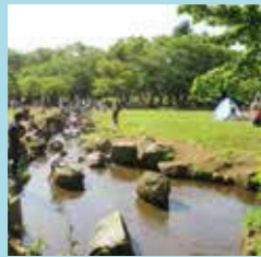
遊具やBBQエリア(1週間前～要予約・有料)、水あそびができるエリアは子連れに大人気!