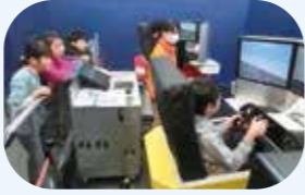
展示館ではフライトシミュレーターにも挑戦できる!

第一線で活躍した飛行機やヘリなど航空にまつわるさまざまな資料の展示のほか、映像、体験、イベントが楽しめる!