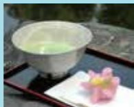
茶室「彩翔亭」で、日本庭園を眺めながらお茶と和菓子をいただくのもおすすめ(一服430円)。