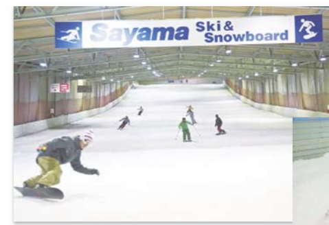
全長300m、幅30mのゲレンデはスノーボードもOK！