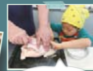
ローストチキンを作ろう！