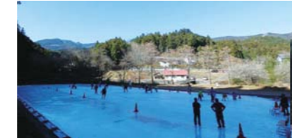
野趣あふれる景色を堪能しながらの滑走は、上サならではの

毎年、地元関係者の手で設営される天然氷のスケートリンク。大自然に囲まれたリンクには、毎年、多くの家族連れが訪れます。1月にはイルミネーションの中でスケートを楽しめるときがわ氷まつりも開催。【営業予定期間】2017年12月下旬～2018年2月中旬