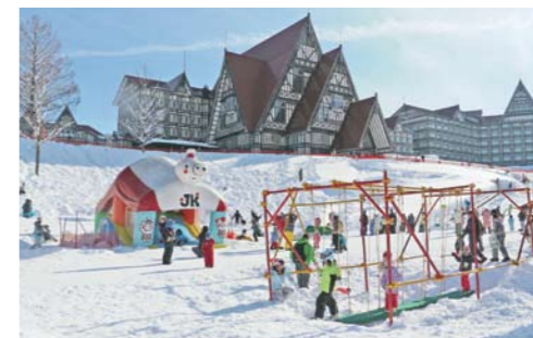
キッズパラダイスやソリランドで、いろんな遊具やソリに挑戦！

広大な敷地には初心者から上級者まで、子どもから大人まで楽しめるコースや施設、イベントが勢ぞろい。宿泊して遊び倒すのがオススメです！大宮からは新幹線で1時間強のロケーションも魅力。早割やバック料金でお得に楽しんで。リフト券付、レンタル付などお得な宿泊プランも続々登場しています。