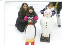
氷上そり(有料)を使えば、初めてのお子様も安心