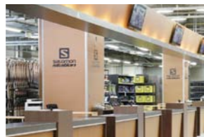
レンタルウェアはサロモン社製の最新モデル中心。そのレンタルもOK