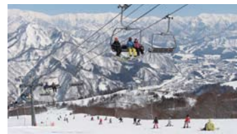
4～12歳のスキー&スノーボレッソンや雪遊びはゲレンデ中央エリアで

日帰りも楽々、エリア最高クラスの雪質が自慢のスキー場。ソリあそびゲレンデや雪あそびコーナーは、小さな子どもも楽しめます。雪あそびの後はSPA ガーラの湯で冷えた体を温めて。 【営業予定期間】2017年12月16日～2018年5月6日