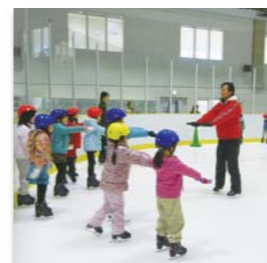
体験レッスンやスケート教室の参加は4歳～

1年中滑走できる2面リンクの屋内アイススケート場。プロ育成選手も利用する本格施設です。休憩したり、おなかを満たしたり、暖をとったりできるラウンジもあるので、ぜひ、子連れで気楽に！