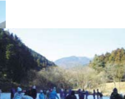
ボランティアの手で設営される温かみあふれるリンクが魅力