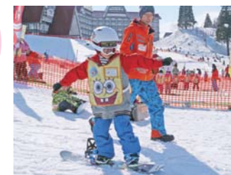
スポンジ・ボブスノーキャンプではキッズ(4～6歳)&ジュニア(7～12歳)レッスンを用意