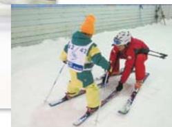
ジュニアのスキー&スノーボードレッスンは小1～4年生向け