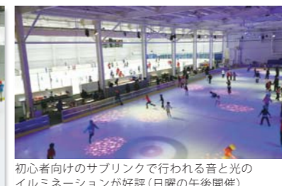
初心者向けのサブリンクで行われる音と光のイルミネーションが好評(日曜の午後開催)