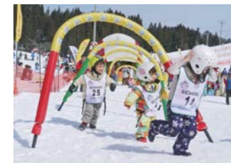
毎週土日は「泳ぐ、走る、乗る」ちびっこトライアスロンを開催