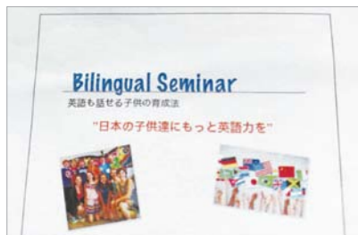
英語学習のキーワード「継続」に必要な、いつ、どこで、どうやって？が詰まったセミナー。

子どもたちの「将来の夢」へのきっかけ作りを行うスマイルママCOMの「Kids Dream Project」の一環として開催した「バイリンガルセミナー」の様子をお伝えします。