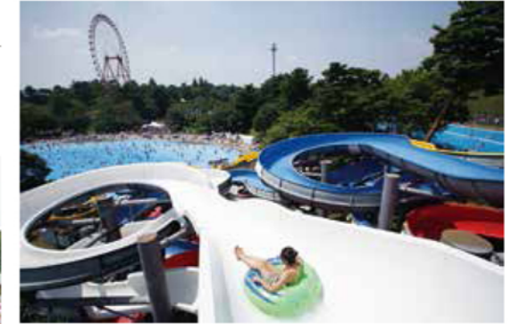
長さの異なるくねくねしたスライダーはスリル満点

DATA 〒 所沢市山口 2964 JR 西武新宿線「西武遊園地」駅下車、西武池袋線「西武球場前」駅よりレオライナー「遊園地西」or「西武遊園地」下車 大人（中学生以上）2400円、小人（3歳以上）&シニア（60歳以上）1300円 10:00〜17:00（期間：7/8〜9/3） 7/12、7/13（予定）※休日の場合は開園 04-2922-1371 ※ナイトプールは、営業日・時間、料金等が異なります