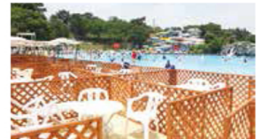
サンデッキや小上がりシートは、氷入りクーラーボックスやコインロッカー付きで快適