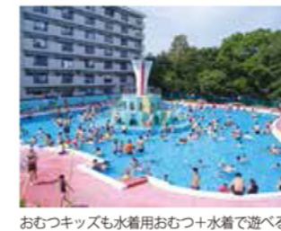
おむつキッズも水着用おむつ+水着で遊べる

埼玉からほど近い都内のプール。子どもプールのみなので、小さなお子様連れにオススメ（付き添いの大人も入場には水着着用が必須）。遊園地（別料金）にも子ども向けの乗り物や動物ふれあい広場、水あそび広場等さまざまな施設を備えていて、コンパクトなスペースにお楽しみが満載です。