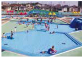
子どもに合った深さを選べる幼児プール

DATA 〒 川口市大字新井宿 700 JR 京浜東北線「川口」駅よりバス「グリーンセンター」下車 一般 540円、高校生 320円、4歳〜中学生 100円 9:00〜17:00（期間：7/15〜8/31） 火曜日（8/29を除く） 048-281-2524（開場期間中）