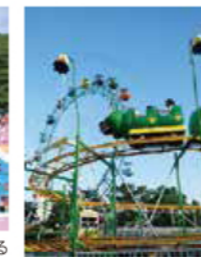
遊園地はファミリーコースター、観覧車、豆汽車など小さい子ども向けアトラクションが充実

DATA 〒 荒川区西尾久 8-10-1 都電荒川線「荒川遊園地前」停留所下車3分、JR高崎線・東北本線「尾久」駅下車11分 大人（高校生以上）350円、小人（中学生以下）150円 10:00〜16:00（期間：7/15〜8/31） 7/18 03-3893-6003