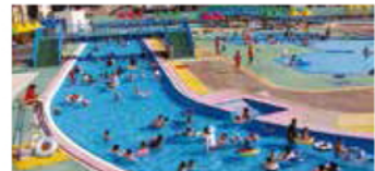
夏はプール場、冬はアイススケート場に変身

1周200mの流れるプールと、六角形をした幼児プールが3面あり（深さ10cm、20cm、40cmとそれぞれ異なる）、家族連れの夏の人気スポットとなっています。隣接するグリーンセンター（植物園）では四季折々の草花のほか、大型遊具やミニ鉄道も楽しめます（入場料別途）。