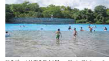
波のプールは渚の長さ150m、ジャングルウォータースライダーやチューブも時間制で楽しめる（別料金）

秩父連山をバックにゆったりと遊泳できるのが魅力。波のプール、流れるプール、幼児用の噴水プールを備えており、パーク内には自然を生かしたさまざまな施設があるので、コテージに泊まってあそびつくすのもオススメ！