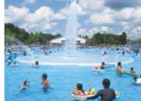
流れるプールは全長350mのスケール

DATA 〒 秩父市久那 637-2 JR 西武池袋線「西武秩父」駅よりバス「スポーツの森」下車 大人（中学生以上）1800円、子ども（3歳〜小学生）800円※秩父市民・小鹿野町民は半額 9:30〜17:00（期間：7/15〜8/31） 無休 0494-22-9284