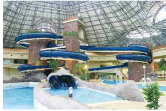
ハイスピードで迫力満点のスピンングスライダー（身長120cm以上〜）

DATA 〒 深谷市榎合 763 JR 高崎線「深谷」駅・東武東上線「寄居」駅よりバス「グリーンパーク前」下車 ※土・日・祝・7/21〜8/31は深谷駅より無料送迎バスの運行あり 大人 1000円、小人（小中学生）500円 10:00（夏季は9:00）〜21:00 火曜日（夏休み中は営業） 048-574-5000