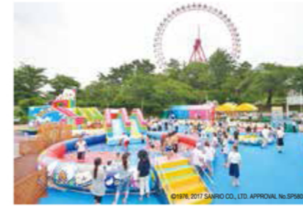
プラス600円（子ども・シニアは500円）でハローキティのウォーターパーク入場と遊園地の入園&アトラクションがセットになる夏の1日券がお得

波打ち際の長さ150mの波のプール、1周500mの流れるプールのほか、カラフルな6コースのスライダー+2種類のふわふわスライダー、ふわふわこどもランド-アクアひろば-や円形こどもプールなども備えています。大人も子どもも、1日中たっぷり楽しめる充実の施設です。