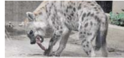
大宮公園小動物園といえばブチハイエナ。オスのホシとメスのキラがお出迎え

大宮公園を散歩がてら、無料なので気軽に何度でも立ち寄れます。ブチハイエナやツキノワグマといった猛獣のほか、タンチョウ、カピバラなどに会えます。鳥たちを間近でみられるフライングケージも魅力的。