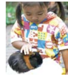
ふれあいや体験、イベントプログラムは、土日祝祭日を中心に開催