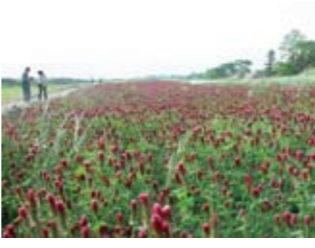
摘み放題のストロベリーキャンドルはGWが見ごろ