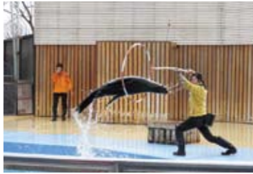
1日2回のショーでは、オットセイたちが華麗な技を披露

約120種類1200頭の動物たちが飼育されている大規模な動物園だけあり、イベントや体験プログラムも豊富。遊園地やプールも併設されており(料金別途)、子どもも大人も楽しめる本格的レジャー施設です。