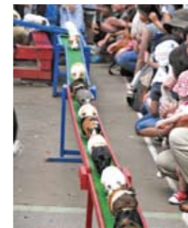
モルモットの橋わたり。ふれあいタイム終了時に行列で小屋へ戻る姿が愛らしい

広々とした自然豊かな園内には「冒険の森アスレチック」「自由広場」「野外ステージ」「コバトンとりで」「ジャブジャブ池」など、動物以外のお楽しみも盛りだくさん。屋内施設が充実の「こどもの城(入場料別途)」では、ボールプールやすべり台を備えた「発見の部屋」や、「えほんのどうぶつえん」が子どもたちに人気です。また、大東文化大学所蔵の『ピーターラビットのおはなし』の作者に関する貴重なコレクションを展示している「ピアトリクス・ポター資料館(入場料別途)」は、ポターが湖水地方で買い取ったヒルトップ農場を再現。大人が楽しめる場所です。