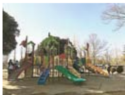
公園の大型遊具や夏季限定のジャブジャブ池、釣り池、バッテリーカーなども家族連れに人気

大崎公園内にある小さな動物園。レッサバングのほか、アメリカアカリス、カピバラなど約45種類の動物に会うことができます。