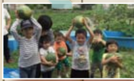
2016年夏の収穫祭ではスイカを採ったよ!