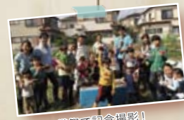
秋の収穫祭で記念撮影!

親子でファーム体験は農業体験を通じ、食べ物を育て収穫することのよさ、そして「親子の絆」を深める活動です。季節ごとに収穫祭や旬の季節を楽しむワークショップも行っています。ぜひご家族でご参加ください!