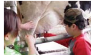
乳しぼり、バター作り、ブラッシング、ほ乳、牧草の給餌が体験できる(2日前までに予約)

牛をはじめ、ロバ、猫、チャボ、ミニブタ、ウサギにも会える賑やかな牧場。自家製ジェラートやヨーグルトなど牧場の恵みも魅力的です。食材持参でバーベキューを楽しむのもオススメ。