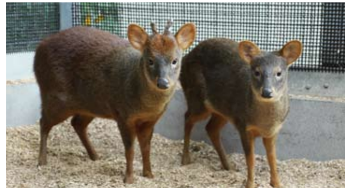
体重約9kg。世界最小のシカ「プーズー」に会えるのは日本でここだけ!

キリン、コアラ、カンガルー、モルモットなど、子どもにも親しみやすい動物たちが待っています。ポニーの乗馬、牛の乳しぼり、エサやり体験などのプログラム、イベント(一部有料)もいろいろ。