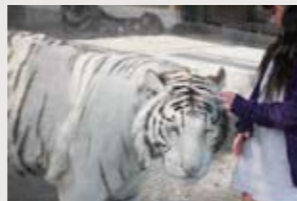
国内での飼育頭数35頭程度の希少なトラ、ホワイトタイガーに会える

東武動物公園一の人気者は「ホワイトタイガー」。その正体は、インドに生息するベンガルトラの突然変異によって生まれた「白変種」です。通常は黄褐色の毛の部分が白やクリーム色をしており、黒や茶の縞部分の色も淡いのが特徴。また、目はアイスブルー(通常は黄)、肉球はピンク(通常は黒)色をしています。動物園に行ったら、お子さんと一緒に確かめてみてはいかが?