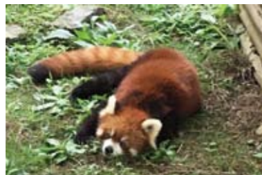
園の一番人気! 高齢のレッサバングのんびりと暮らしている