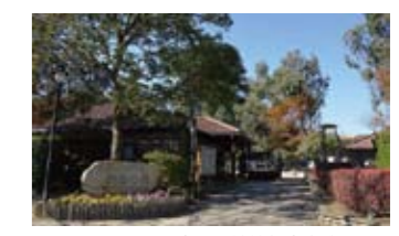
キャンベルタウン市との姉妹都市交流10周年を記念して開設。エミューやアカクワヒューがいるエリアもある