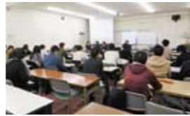
埼玉大学教育学部学校教育臨床専修4年生 28名 2017年度に小中高校での採用が決まっている学生多数。教職以外の就職内定者も含む。